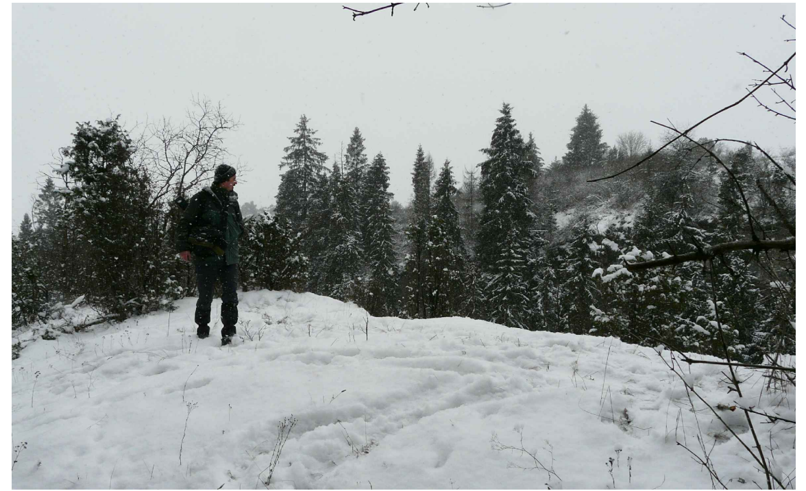
fotografie - súčasný stav